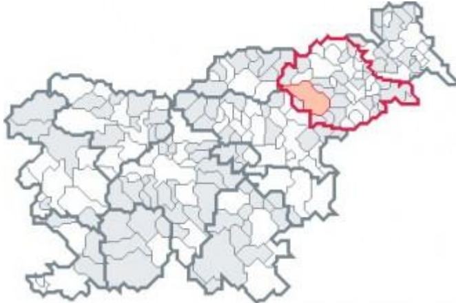
SLIKA 1: PODRAVSKA REGIJA Z OBČINO SLOVENSKA BISTRICA

Koncentracija gospodarskih dejavnosti in prebivalstva na nekaterih območjih sta v preteklosti povzročila različne pogoje za življenje in delo (razlike v prostorski razporeditvi delovnih mest, stopnji brezposelnosti, v izobrazbeni strukturi prebivalstva), neustrezno prometno povezanost in neenakomerno dostopnost. Problemi so še posebej izraziti v strukturno zaostalih in ekonomsko šibkih območjih s pretežno agrarno usmeritvijo, v območjih z demografskimi problemi, z nizkim dohodkom na prebivalca ter v ekonomsko in socialno nestabilnih območjih.