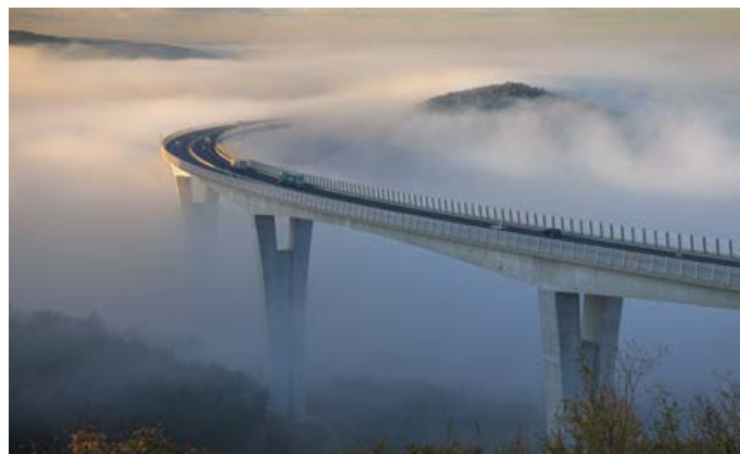
Viadukt Črni kal