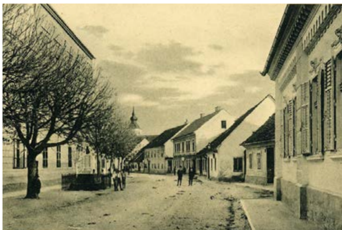
Šolska ulica

študirala farmacijo in se je poročila z Brozem.